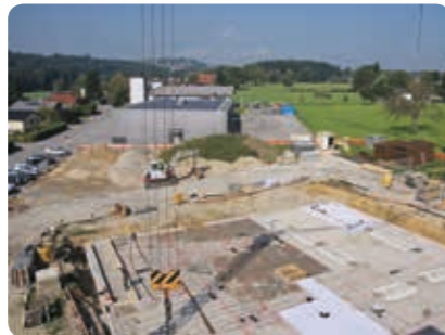
Aufnahme vom 22. September