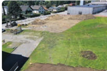
Aufnahme vom 23. Juni