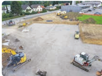
Aufnahme vom 8. Juli