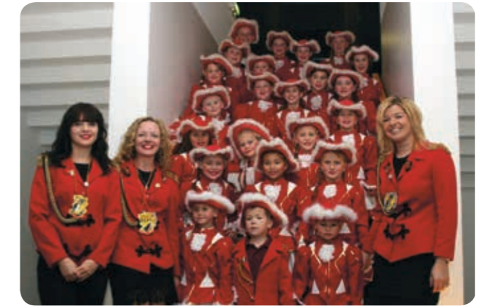
Bericht: Hörbranzer Raubritter

Auf ihren Besuch freuen sich die Hörbranzer Raubritter, die Kindergarde Hörbranz, die Leiblachtaler Schalmeien, die Leiblacher Fetzaeha, das noch amtierende Prinzenpaar und natürlich das neue Prinzenpaar 2016/2017!!