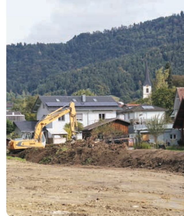
Nägele-Bau/Haider im Zeitraum vom 03.10.2016 bis voraussichtlich 17.04.2017 ausgeführt, vom 19.12.2016 bis 16.01.2017 ist eine Winterpause geplant.

Nachstehende technische und ökologische Schutzmaßnahmen werden gebaut: