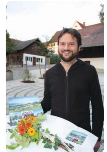
Autor Thomas Metzler

Das Kloster Gwigen in Hohenweiler war zum Gastgeber der Buchpräsentation „Das Leiblachtal, eine Region und ihre Menschen“ von Thomas Metzler auserkoren worden. Langjährige Tradition traf hier auf aktuelles Zeitgeschehen.