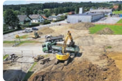
Aufnahme vom 29. Juni