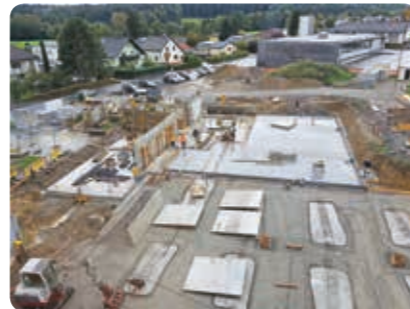
Aufnahme vom 03. Oktober