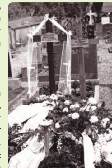
Grab von Werner Zugger

Einer der Angler zeigte uns den Baum an der Leiblachmündung, unter dem Werner nach dem Unwetter aufgefunden wurde. Wir Buben hatten die verrückte Idee, geheim einen Teil dieses (bö-