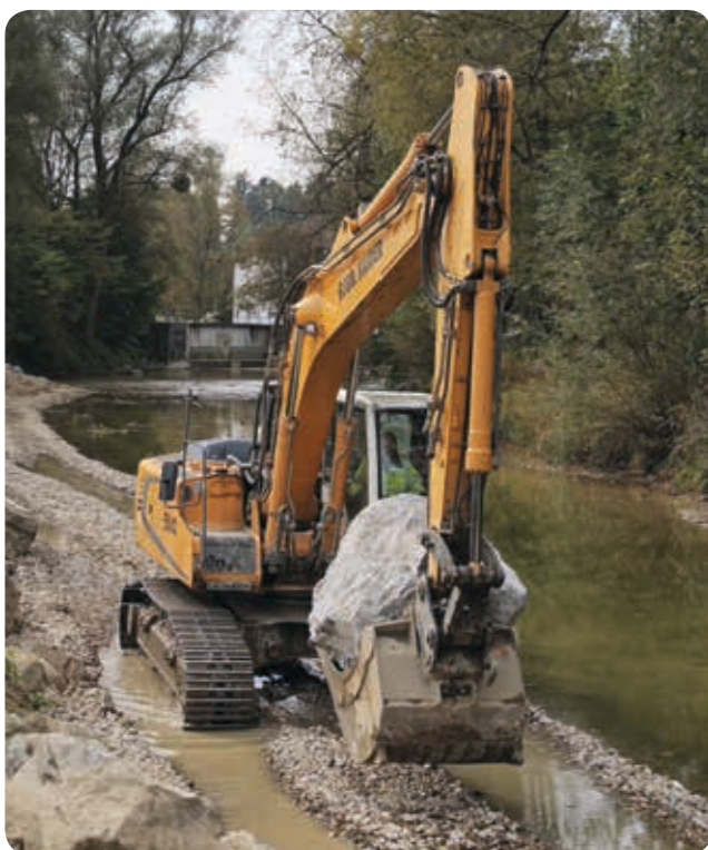
Baustart: Hochwasserschutz an der Leiblach - Bericht Seite 7