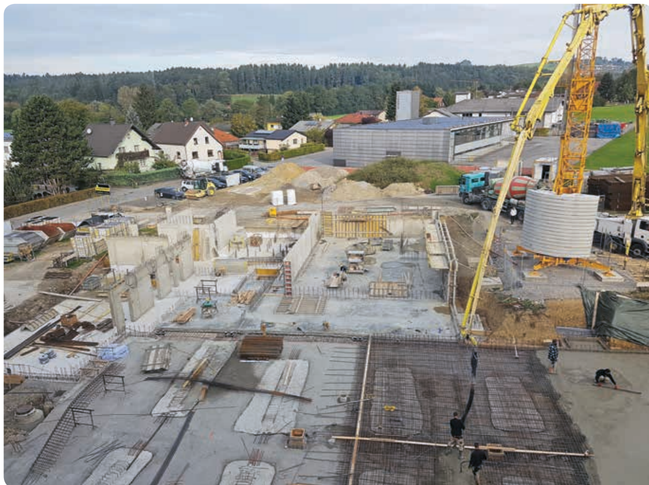
Aufnahme vom 6. Oktober