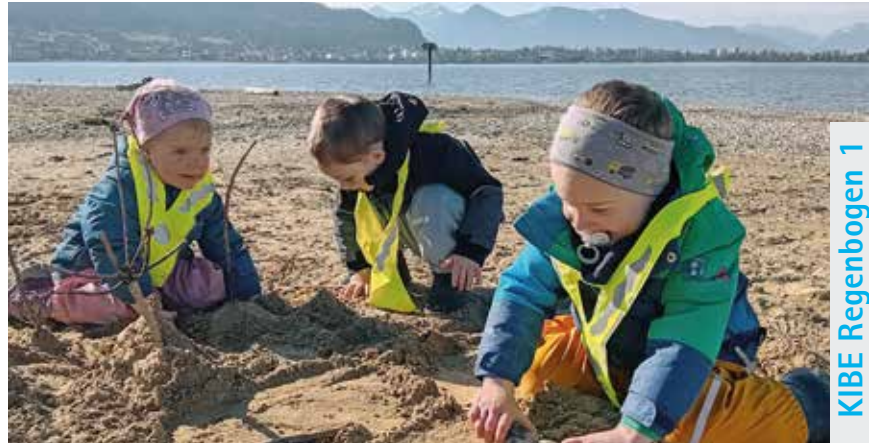
KIBE Regenbogen 1