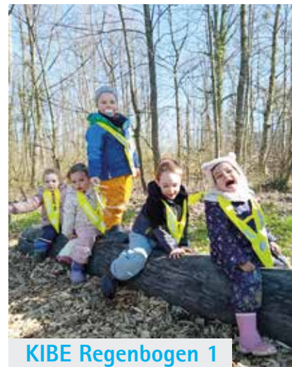
KIBE Regenbogen 1