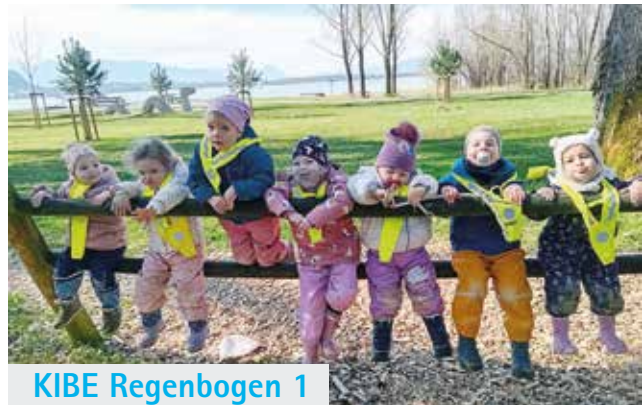
KIBE Regenbogen 1