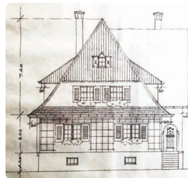
Die Villa wurde 1923/24 errichtet.