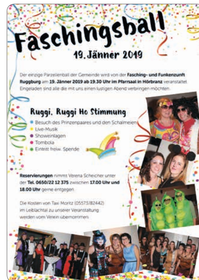
Bericht: Beate Winkler

Die Kosten von Taxi Moritz +43 5573 824 42 im Leiblachtal zu unserer Veranstaltung werden vom Verein übernommen.