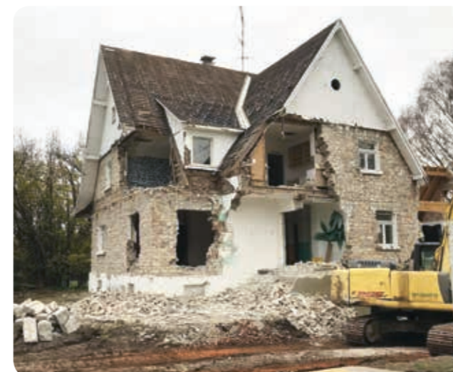
Der Abbruch erfolgte im Herbst 2018.