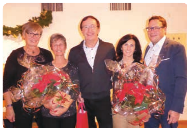
Riegenleiter der TS-Hörbranz