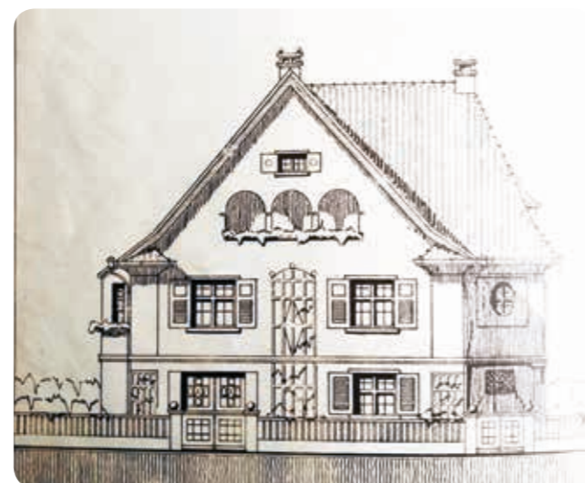
Dieser Plan aus dem Jahre 1913 wurde nicht verwirklicht.

die Baugenehmigung erteilt. 5 Tage später – am 28. Juni – war das Attentat von Sarajewo auf den österreichisch-ungarischen Thronfolger Erzherzog Franz Ferdinand und seine Gemahlin Herzogin Sophie Chotek. Einen Monat später – am 28. Juli 1914 – begann der 1. Weltkrieg und der Bau der Bilgeri-Villa wurde nicht durchgeführt.