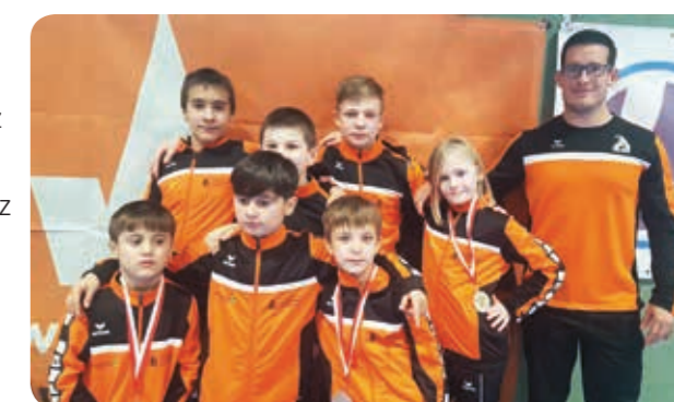
Berichte: Tatjana Ratz