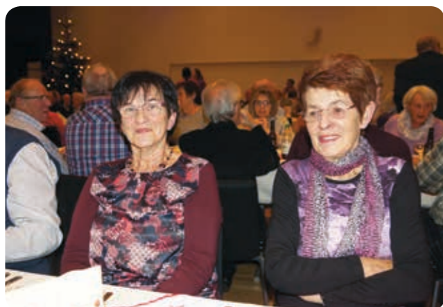
Seniorenweihnachtsfeier der Gemeinde - Bericht Seite 4